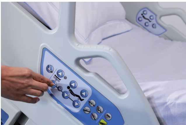
Poignées assurant une bonne prise en main et commandes intégrées