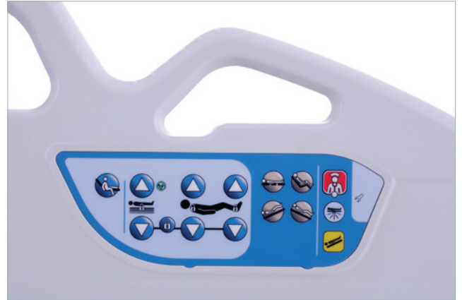
Indicateur de position basse et positionnement de sortie de lit à commande unique