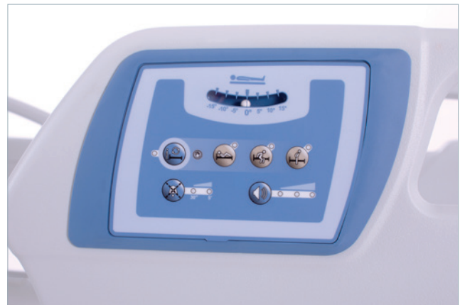
Alarme de sortie de lit à 3 modes en option