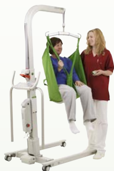
Golvo™ Charge max. : 200 kg