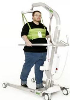
Viking™ L Charge max. : 250 kg