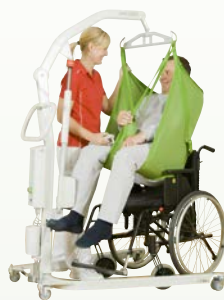
Uno™ 100/102 Charge max. : 175-205 kg Uno™ 200 Charge max. : 160-200 kg