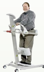
RollOn™ Charge max. : 160 kg