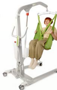
Viking™ S Charge max. : 160 kg