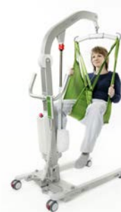
Viking™ XS Charge max. : 160 kg