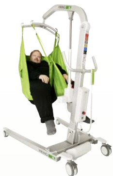
Viking™ XL Charge max. : 300 kg