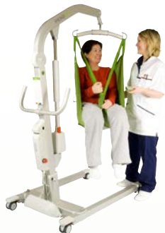
Viking™ M Charge max. : 205 kg