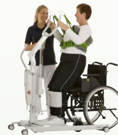
Sabina™ II Charge max. : 200 kg Sabina™ 200 Charge max. : 160 kg