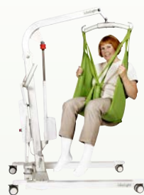
LikoLight™ Charge max. : 140 kg