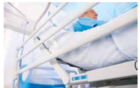
Line-Of-Site Anzeige ermöglicht einfache Patientenpositionierung