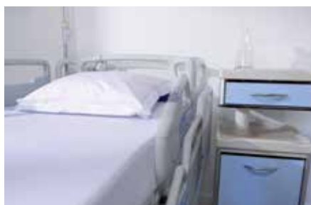
Seitensicherungen nehmen nur 4 cm der Bettbreite ein